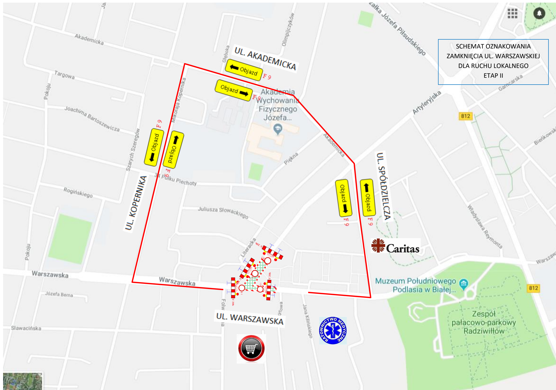
SCHEMAT OZNAKOWANIA ZAMKNIĘCIA UL. WARSZAWSKIEJ DLA RUCHU LOKALNEGO ETAP II